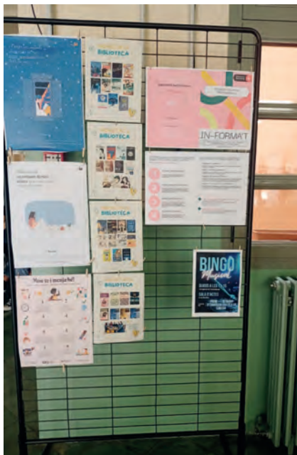
FIGURA 8. Tauler informatiu al vestíbul del centre amb informació de la biblioteca, com ara les novetats o les activitats.

els no lectors. Quan dissenyem una activitat de foment de la lectura, l'han de poder viure i gaudir tots els destinataris: lectors forts, lectors febles i no lectors; procurem no caure en el «fonamentalisme lector» que esmenta Víctor Moreno (2009: 18-19). Quant a la integració de la tecnologia (tema massa extens, complex i profund per aturar-nos a examinar-lo), només mencionarem que ha de tenir un sentit: la tecnologia per si sola, en la nostra experiència, no fa més ni millors lectors. També cal valorar el mitjà més efectiu per arribar al destinatari: per exemple, hem pogut comprovar que té més impacte i visibilitat posar les novetats impreses a l'entrada del centre que no pas difondre-les a les xarxes socials (els joves empen les xarxes per relacionar-se entre iguals, més que no pas amb entitats, i encara menys si estan relacionades amb l'àmbit educatiu). Utilitzem eines digitals per elaborar llibres multimèdia, complementar o enriquir continguts relacionats amb la