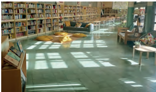
FIGURES 1 i 2. Zona de lectura informal per a grups petits i grans.