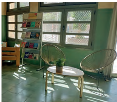
FIGURA 3. Zona de lectura informal per a parelles i individual.