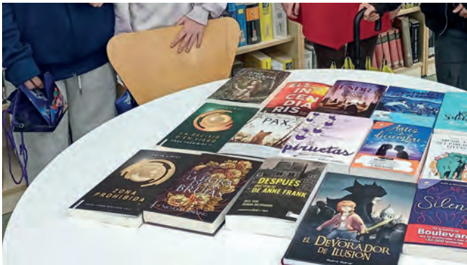
FIGURA 12. Volums comprats per l'alumnat del Comando Sant Jordi a la llibreria del barri.

Aquestes accions també volen incidir en els aspectes socials de la lectura i en la necessitat d'estar amb el grup que tenen els adolescents; encara que els investigadors no ho mencionessin (BUENO 2017), qualsevol persona que treballi amb adolescents s'adonaria de la importància que té per al col·lectiu.