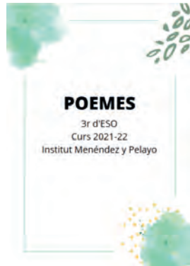
FIGURA 7. Difusió al web de la biblioteca de poemes de l'alumnat elaborats a l'aula.

Sovint els treballs literaris de l'alumnat resten desats de manera interna als espais físics i digitals del centre. La comunitat educativa disposa d'una plataforma pública, com és el web de la biblioteca, per poder mostrar al seu entorn les seves creacions literàries (recordem que cal anonimitzar-les o presentar-les sota pseudònim).