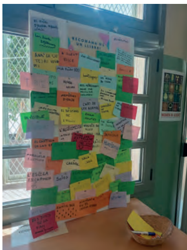
FIGURA 9. Recomanacions entre iguals.

«Recomana'ns un llibre», unes cartolines de colors, un pot de xinxetes i un retolador (figura 9). Va tenir tant d'èxit que en poc temps estava ple; per visibilitzar el valor que donem a les recomanacions que ens fa l'alumnat, quan es renova el plafó (un cop ple), l'alumnat del Servei Comunitari de Biblioteca les digitalitza i elabora el Llibre de recomanacions anual en format digital. No només dona valor a les seves lectures autònomes, també proporciona molta informació sobre els seus hàbits i preferències lectores. També fem difusió al web de les recomanacions de l'alumnat, al mateix nivell jeràrquic que les de la biblioteca i les de docents i famílies (figura 10).