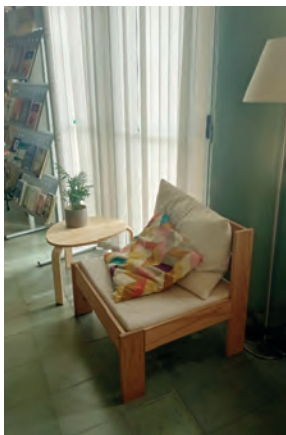
FIGURA 4. Zona de lectura informal individual.