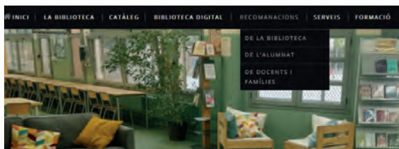
FIGURA 10. Recomanacions de l'alumnat al web de la biblioteca.