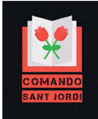
FIGURA 11. Comando Sant Jordi.